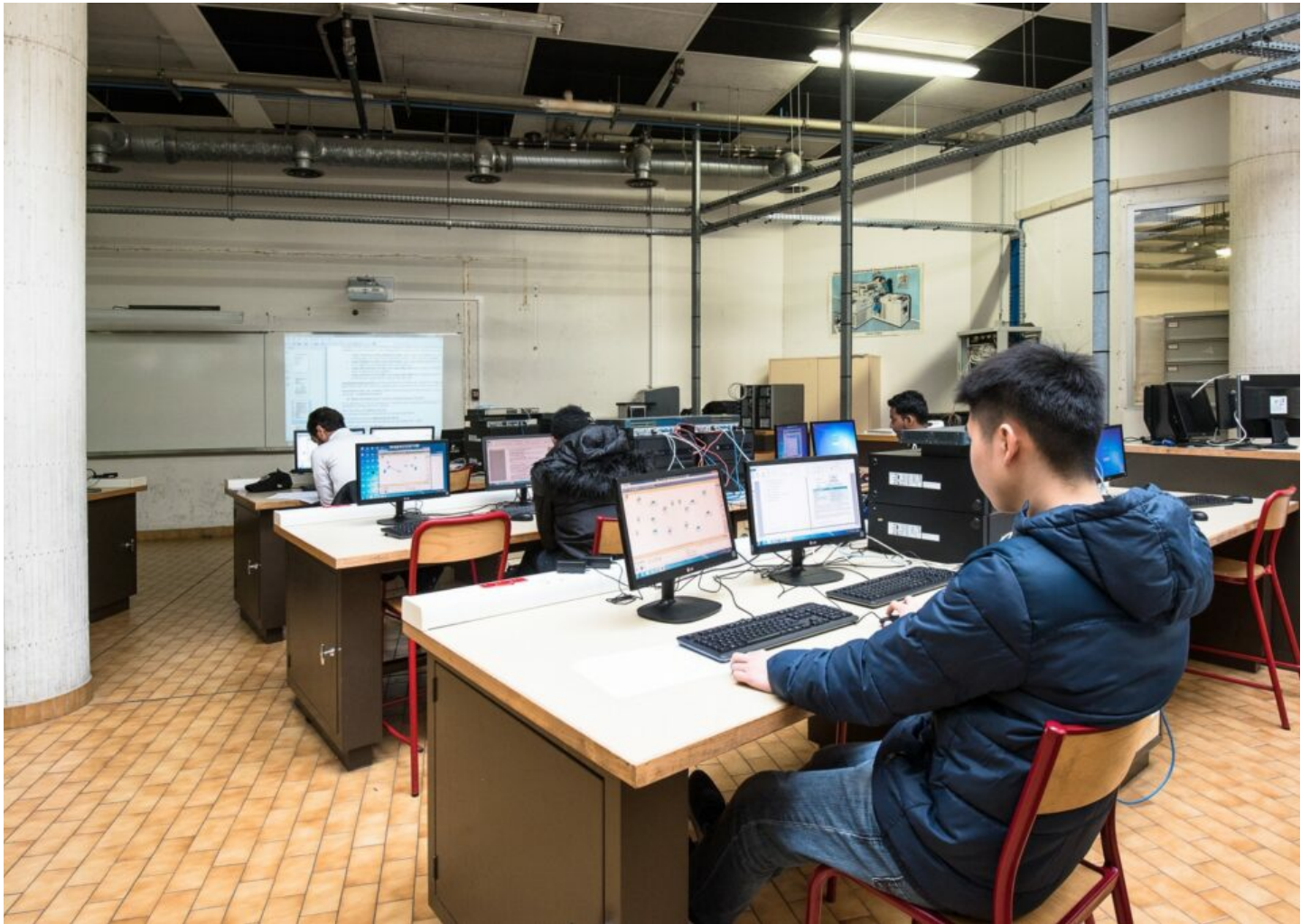
Salle de formation du lycée dédiée au travail sur les réseaux informatiques, paramétrage, administration, maintenance (salle Baudot).