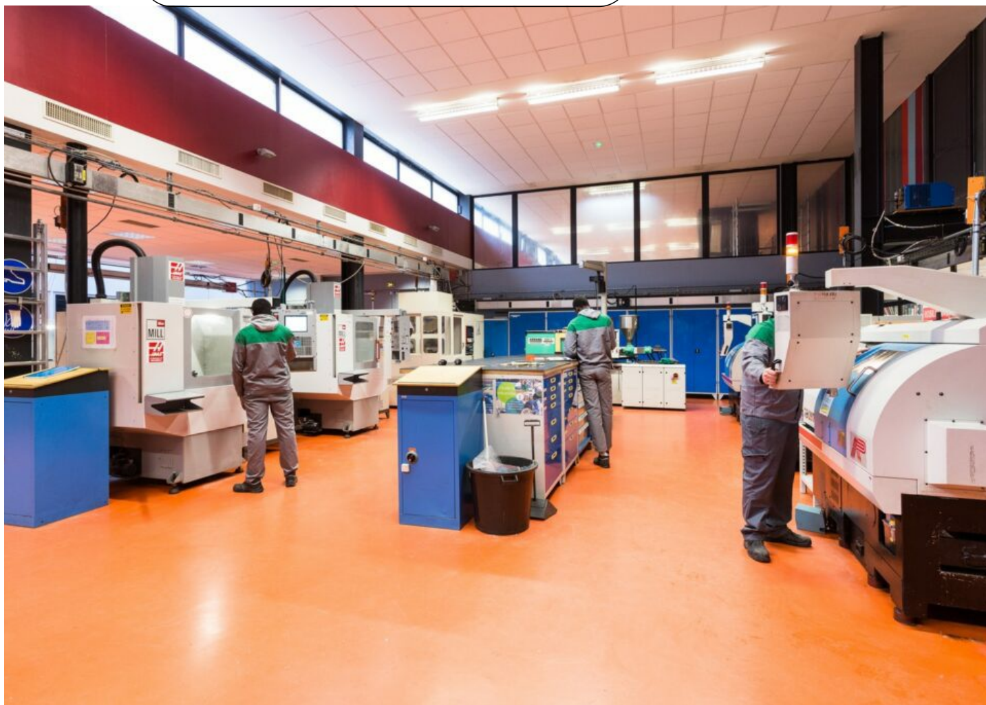
Atelier de productique dans lequel se déroulent les cours du Bac Pro Technicien d'Usinage.