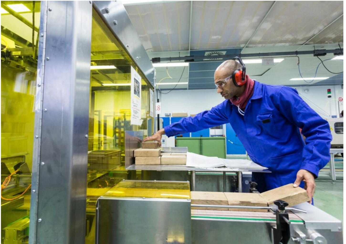
Encaisseuse CERMEX utilisée par les stagiaires du Bac Pro Maintenance des équipements industriels.