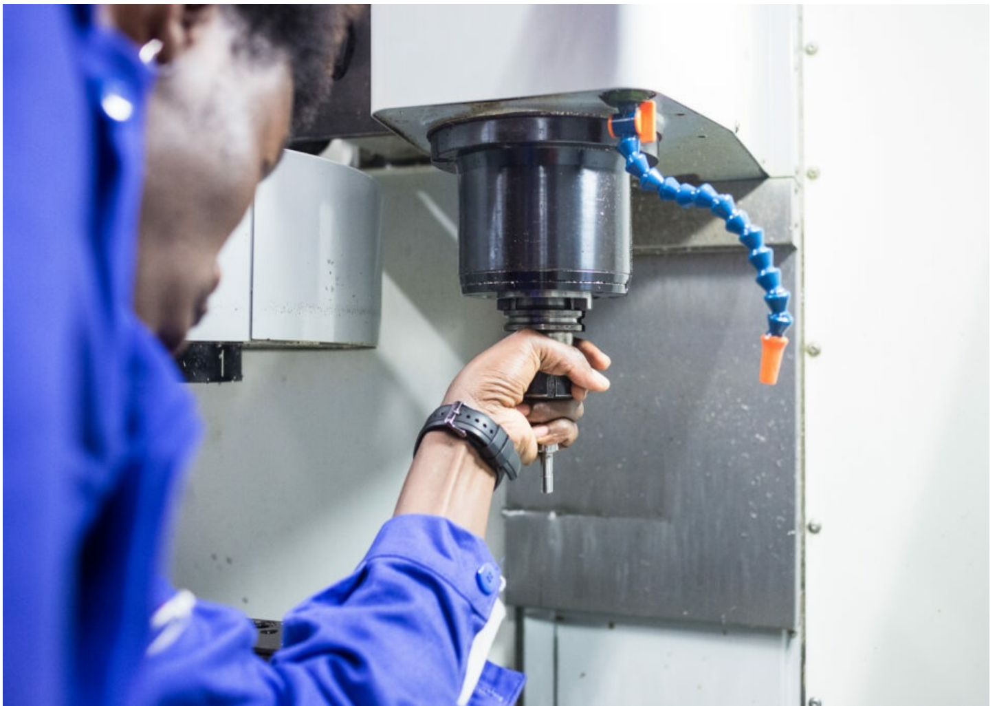
Centre d'usinage Hass Mill utilisé par les stagiaires du Bac Pro Technicien d'Usinage.