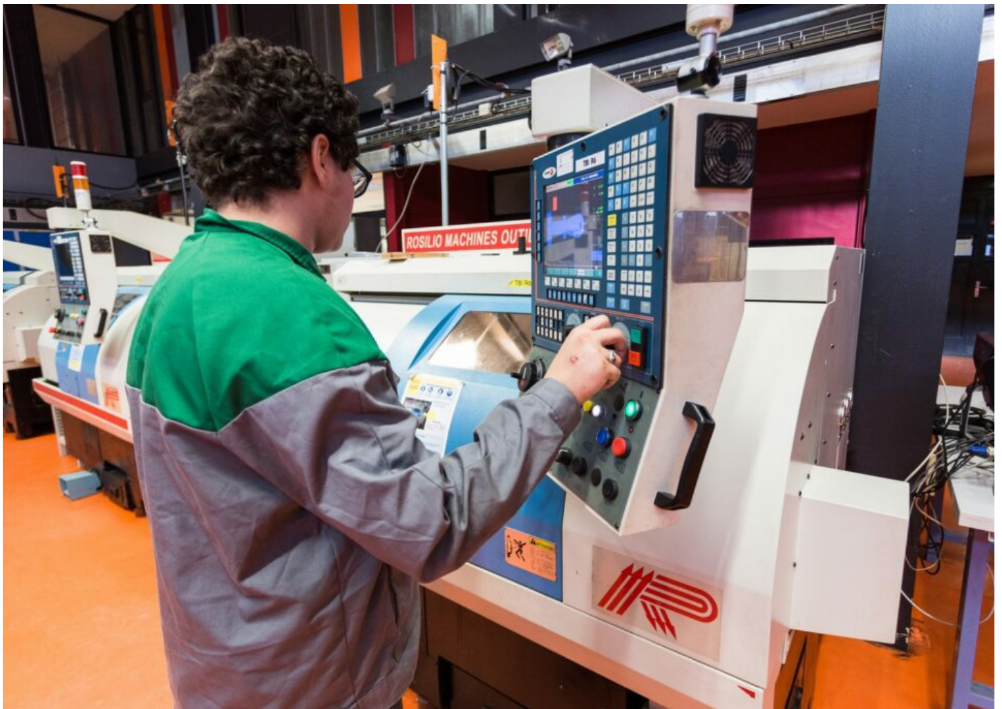
Machine Outils Rosilio: tour à commande numérique utilisée par les stagiaires du Bac Pro Technicien d'Usinage.