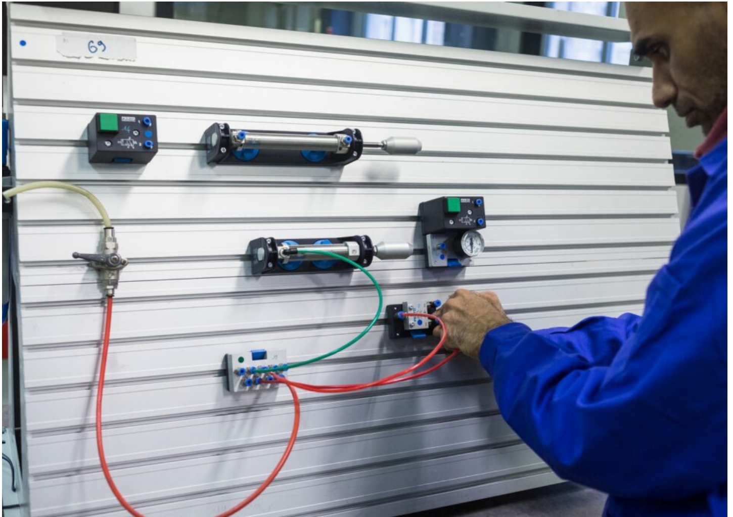
Pupitre d'automatisme utilisé par les stagiaires du Bac Pro Maintenance des équipements industriels.